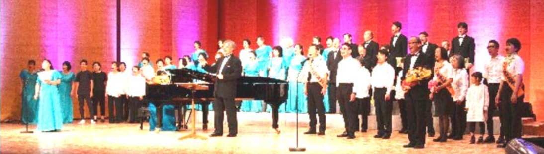
前回2019年音楽会「未来をかけて」フィナーレ

会場の件で二転三転しましたが、12月3日荏原文化センターを確保することができました。 来春は、コロナ禍以降全くなかった演奏依頼も何件か頂き、好スタートを切ることが出来そうです。音楽会に向けたレッスンも本格的に開始します。 今の政府は、軍事費倍増や保険料値上げ年金引き下げ等などに邁進し、物価高騰に対してはも何ら手を打たず、国民の声を全く聞くことなく生活を脅かしています。今こそ南部合唱団が長年歌い継いできた「日本国憲法九条」「日本国憲法前文」などを高らかに歌いたいと思います。音楽会を成功させる為には団員一人ひとりが、基本に