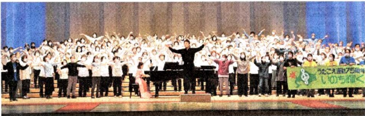
▲特別音楽会フィナーレ、「星となれ!ボクらのうたよ」(竹中正道詞、藤村記一郎曲。指揮:和賀達郎)

ace be with you」を うたいました。 第二部「未来を拓くチ カラ」は、青年のうた ごえ「平和の鐘」をメ インにメドレーでうた われ、とてもよかった です。フィナーレの 「星となれ!ボクらの うたよ」も大勢の方た ちの舞台、とてもス テキでした。 ○12月4日○日 本特殊陶業市民