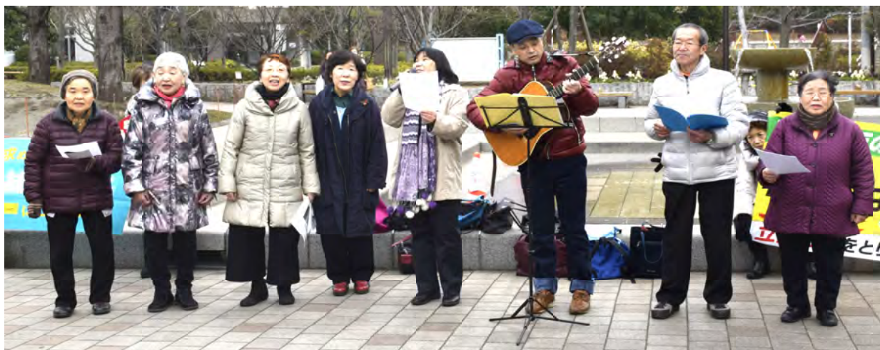
冷え込み厳しい中、パレードの前に南部合唱団も「憲法九条」などの演奏をさせて頂きました。パレード開始時には送り出しの演奏も!