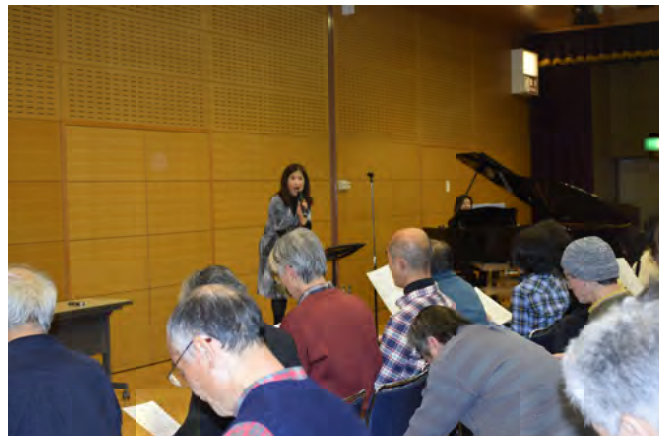
2/6 夜 3/19チャリティーコンサートの合同レッスン 楽しくもためになる、濃密な2時間でした!本番がんばろう