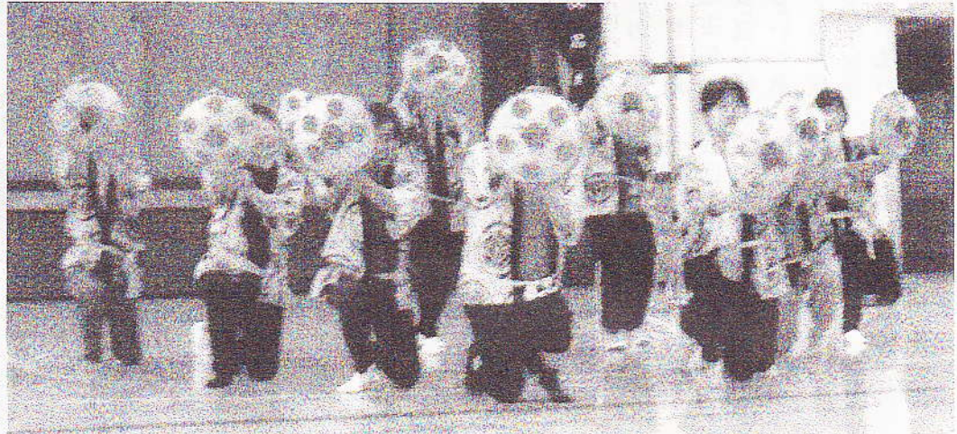
去る10月14日の通し稽古にて、花笠音頭の最後の決めポーズ！

土芸能と合唱の音楽会「ひびけ明日へ心づな」で、2日と迫りました。今回の音楽会は、東日本大震災の被災者の方々を心よせ、一日も早い復興を願ってプログラムを組みました。郷土の歌と踊りの演目は、故郷の大地を想い、農作業などの労働を讃える想いをこめて演奏しました。郷土部